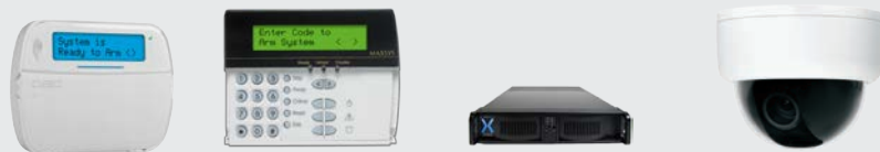
Panels de alarma DSC PowerSeries Neo y MAXSYS exacqVision NVR Mini domos Discover